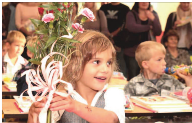
Poprvé ve školních lavicích