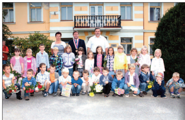
Noví čkyňští prvňáčci